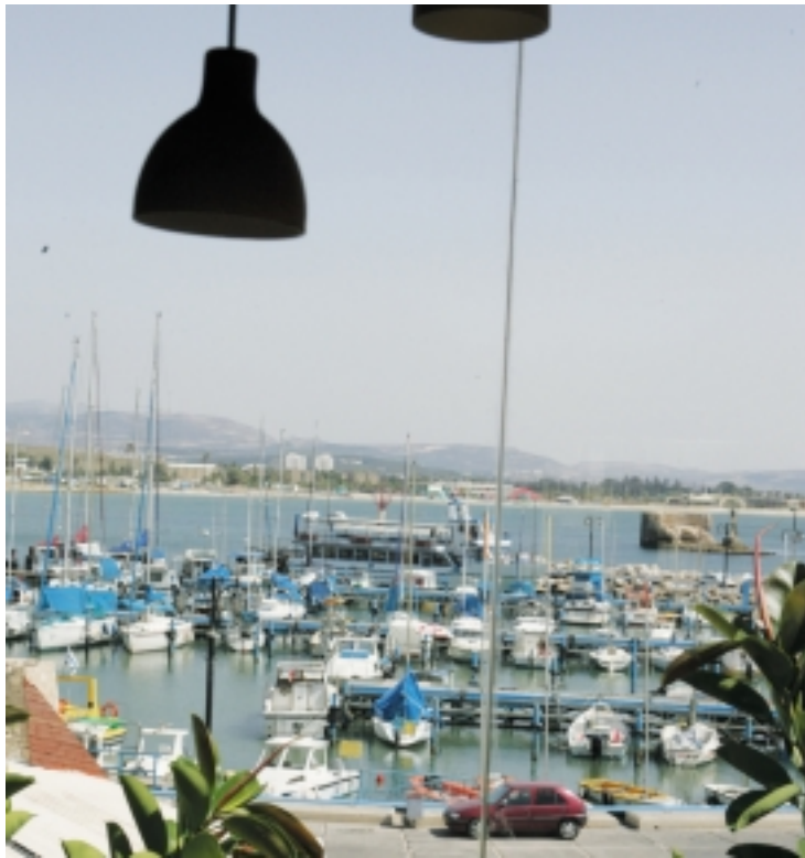
הנמל בעיר עכו

לנקרי מוזה בטענות האלה מימד פוליטי. "אם תשאל את הציג הקומוניסטי במעצת העיר, הוא אף פעם לא יהיה מרוצה. הם חרטו על דיגלם את השוויון האבסולוטי, וזה לא קיים. הוא תמיד נותן לי להרגיש, כאילו לא עושים מספיק, אבל זה נשאר ברמת ההתבכיינות המסורתית". לנקרי דווקא גאה במפגש שיצר עם איש התנועה האיסלאמית בעירייה ועם שיך