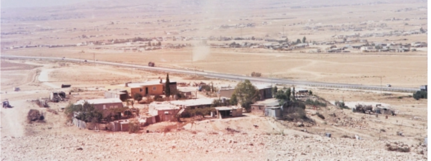
בתמונה: ביר-הדאג'

כתבה שניה בסדרת כתבות על יהודים וبدوים בנגב: "הכפרים הלא מוכרים", סיפור בשלוש מערכות